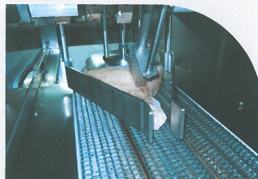
DOTATA DI SERIE DI CENTRATORE PNEUMATICO INOX.

LA SELEZIONATRICE TES/4BS PUO' ESSERE DOTATA DI TIMBRI DI DIVERSE DIMENSIONI, SECONDO LE ESIGENZE DI OGNI SINGOLO CLIENTE. CONFORME NORME IGIENICO SANITARIE E CE.