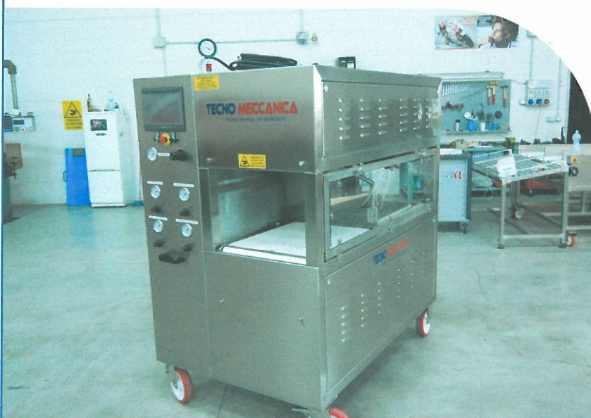
PANNELLO COMANDI TOUCH SCREEN A COLORI

LA MACCHINA PUÒ ESSERE ABBINATA, A SECONDA DELLE ESIGENZE DEL CLIENTE, A NASTRI TRASPORTATORI AD USCITE MULTIPLE IN GRADO DI SEPARARE I PRODOTTI LAVORATI IN BASE ALLA CLASSE DI PESO CUI APPARTENGONO.